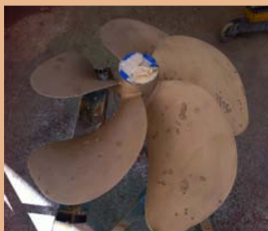
Sablage de l'hélice