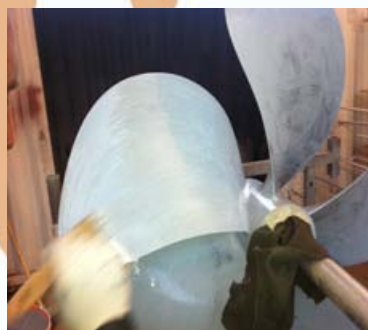
Reconstruction des points au BELZONA 1111 et application d'un revêtement pour augmenter la fluidité, le BELZONA 1341 première couche.