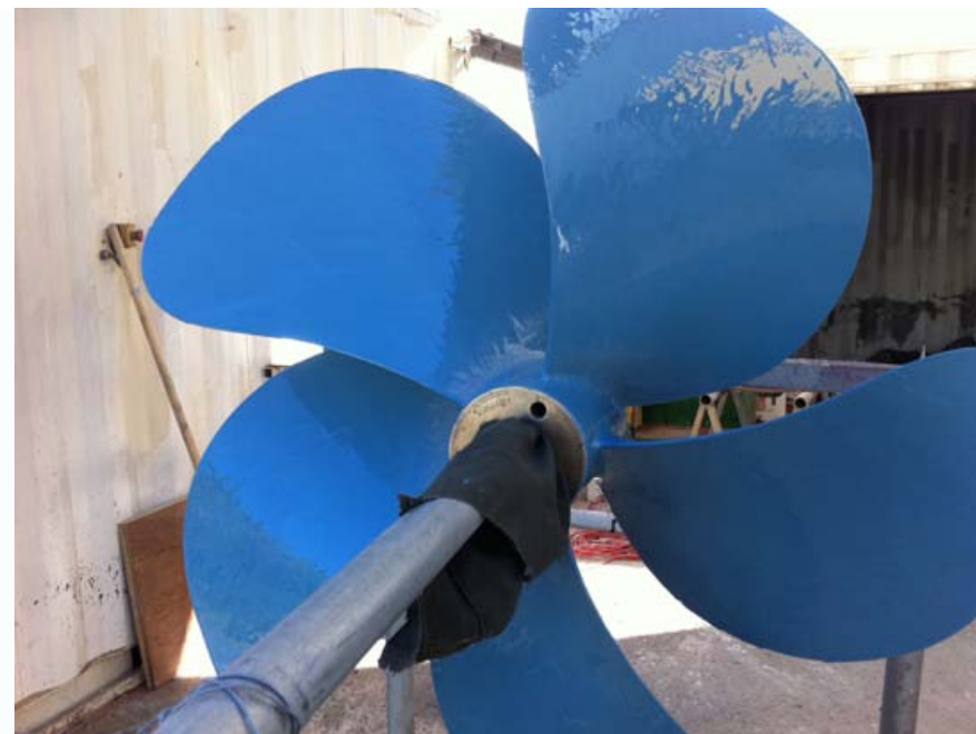
Application de la deuxième couche de 1341 de chez BELZONA (bleu).