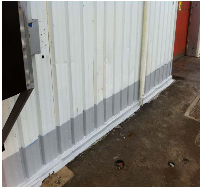
Revêtement d'étanchéité terminé