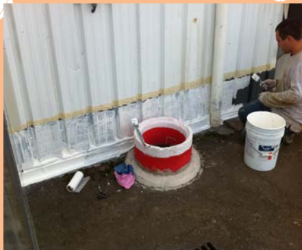
1 ère couche de flexi membrane