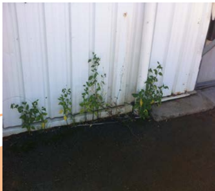
Pied de cloison extérieur

Problème : infiltration en pieds de cloison