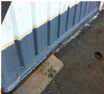
Masquage et primaire